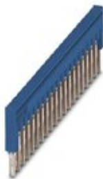
Dugaszolható híd, raszterméret: 3,5 mm, szín: kék

Kérjük, vegye figyelembe, hogy az itt megadott adatok az online katalógusból származnak! Teljes körű tájékoztatást a felhasználói dokumentáció tartalmaz. Az internet-letöltés általános használati feltételei érvényesek. ( http://download.phoenixcontact.de )